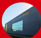
Vilanova del Camí Centre d'Innovación Anoia c. dels impressors, 12 08788 Vilanova del Camí (Barcelona)