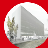
Biopolo La Fe Torre A, Planta Baixa Hospital La Fe Av. Fernando Abril Martorell, 106 46026 Valencia