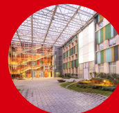
Parc Agrobiotech Edifici CeDiCo Parc de Gardeny 25071 Lleida